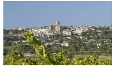
Eguelles Le Village