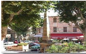
Rognes Le Village