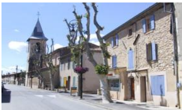
Le Puy Sainte Réparate Le Village