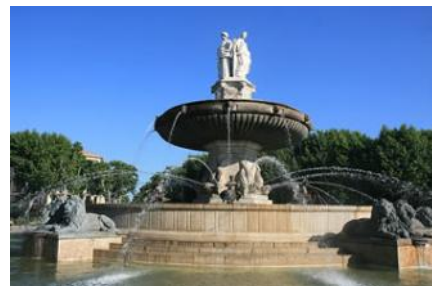
Aix en Provence La Fontaine de la Rotonde

Point de départ – Fontaine de Rotonde – Aix en Provence