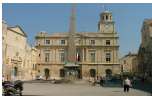
Place de la Mairie d'Arles

Point de départ – Boulevard des Lices - Arles