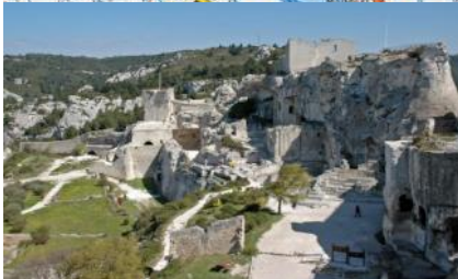
Les Baux de provence