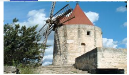
Fontvieille - Le Moulin de Daudet