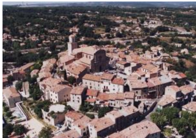
Fuveau Le Village