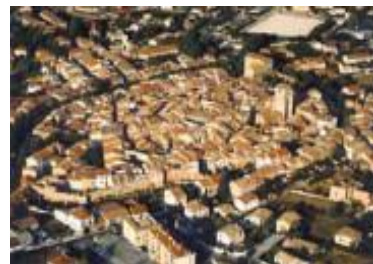
Trets Le Village